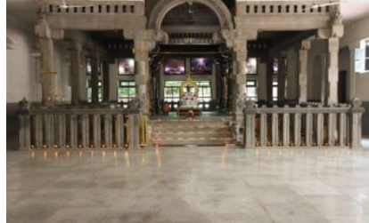
ラマナアシュラムイメージ