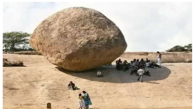
マハーバリプラム と カンチープラム

本旅行はstudio fika 谷戸康洋の旅行企画を基に、 株式会社いい旅が旅行企画実施し、株式会社スカイエフワールドが受託販売を担当するものです