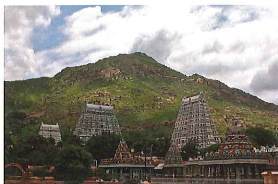
ラマナマハリシの聖地アルナーチャラ寺院