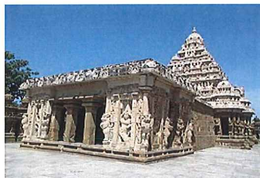
カンチープラム寺院

本旅行はstudio fika 谷戸康洋の旅行企画を基に、株式会社いい旅が旅行企画実施し、株式会社スカイエフワールドが受託販売を担当するものです