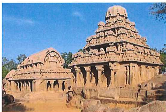
マハーバリプラムの建造物群

旅行代金 303,000 円 (成田空港発着・7名様以上ご参加の場合) 293,000 円 (成田空港発着・9名様以上ご参加の場合) 283,000 円 (成田空港発着・11名様以上ご参加の場合) 271,000 円 (成田空港発着・16名様以上ご参加の場合)